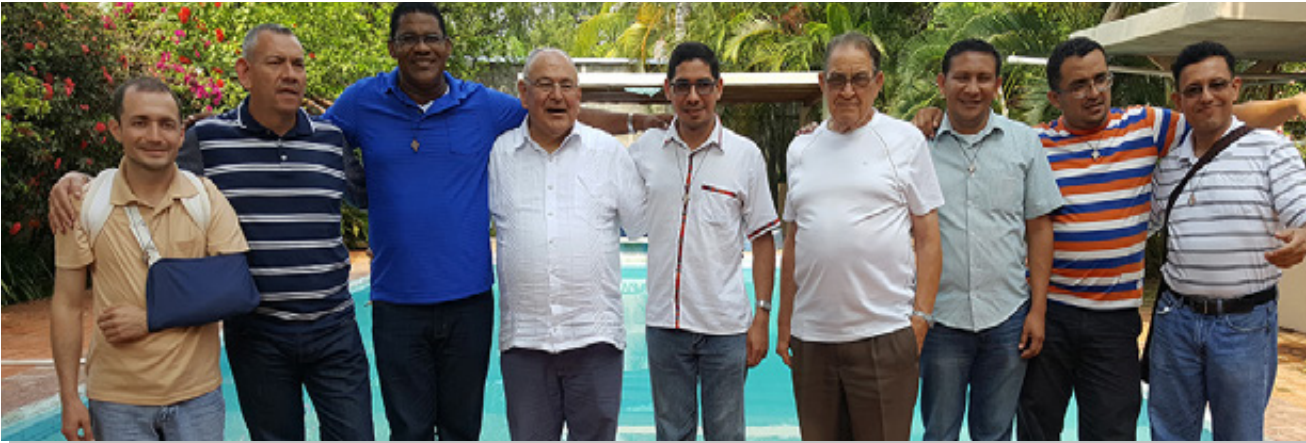
Hogar Zacarias Guerra