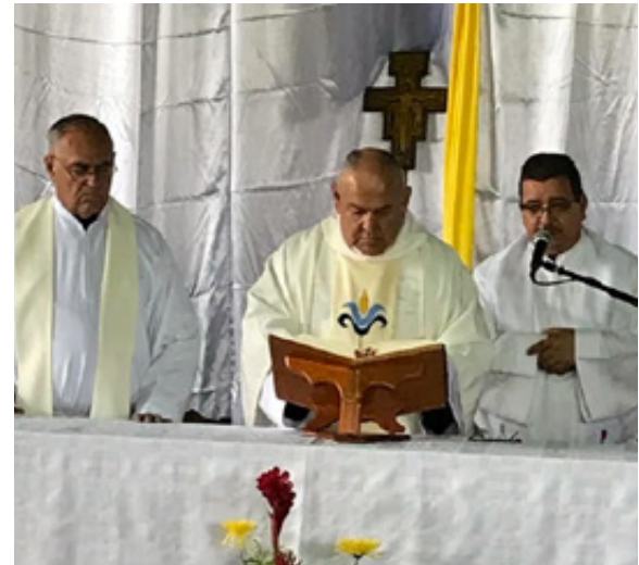
Seminario Luis Amigó