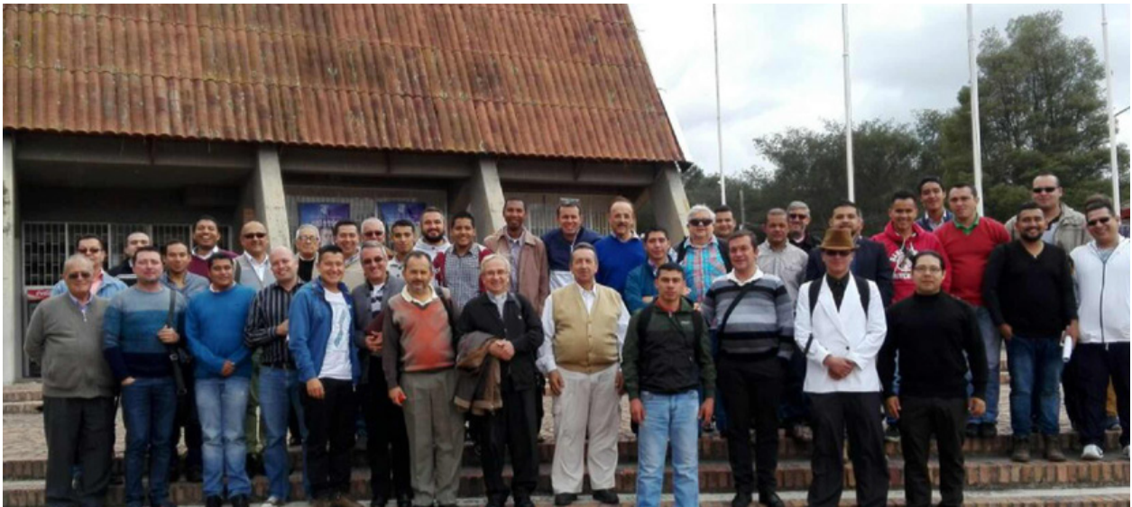
Regional Sabana de Bogotá, Tunja y Yopal