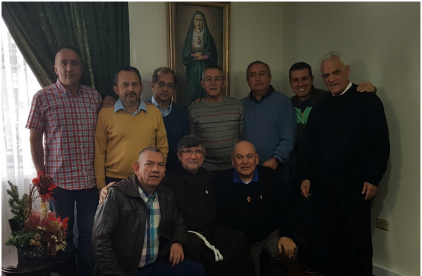
Encuentro Consejo General y Consejo Provincia San José, Bogotá